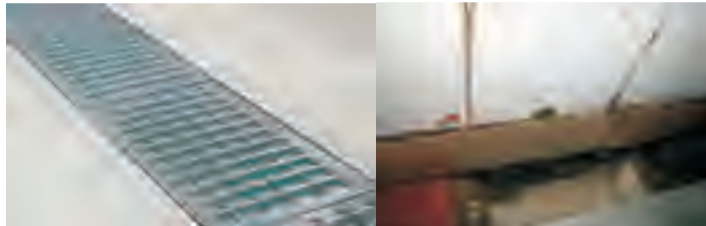
排水沟用带孔的金属板严密封闭，下水道出水口出安装可以拔插的竖算子，最大缝隙不大于10毫米