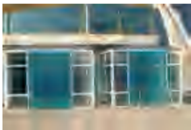
入口处安装塑料门帘、风幕机等防止成蝇进入，塑料门帘底部离地面不大于2厘米