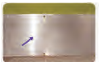
库房等房门钉金属铁皮，高度不低于30厘米，与地面缝隙不大于6毫米