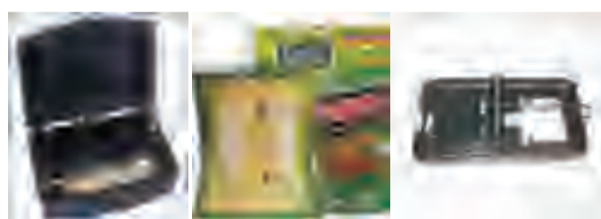
室内可选用带锁的毒饵盒、粘鼠胶、鼠笼、鼠夹等器械进行灭鼠，沿墙放置