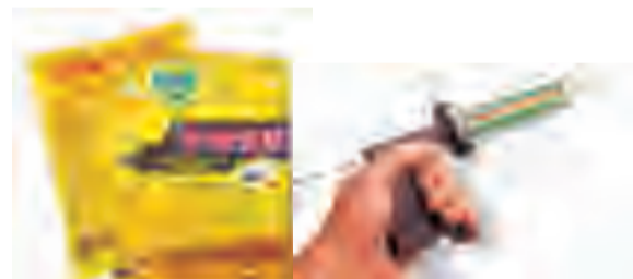
毒饵或胶饵灭蟑时，注意“点多、量少、分布均匀”，蟑螂密集处可适当增加点数

副食店、超市等经营单位应经常组织和发动员工做好周末大扫除活动，讲究卫生，垃圾做到日产日清。如果自行除害有困难的可以请专业除害公司进行除害。相关信息可以从武汉市疾病预防控制中心或武汉有害生物防制协会网站上查找，同时也可关注“武汉虫害防制”微信号或咨询12320公共卫生公益热线了解有关除害知识。